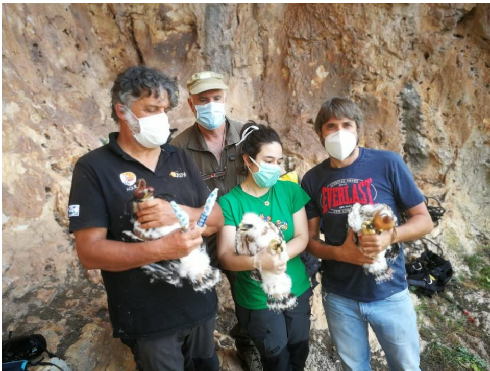
Fig. 1. Marcaje (Acción C3) y extracción de pollos de un nido de Loja, Granada.

Debido a las restricciones de movilidad por el COVID-19, este año no hemos podido extraer ningún pollo de nido de la población siciliana como hicimos el pasado 2019.