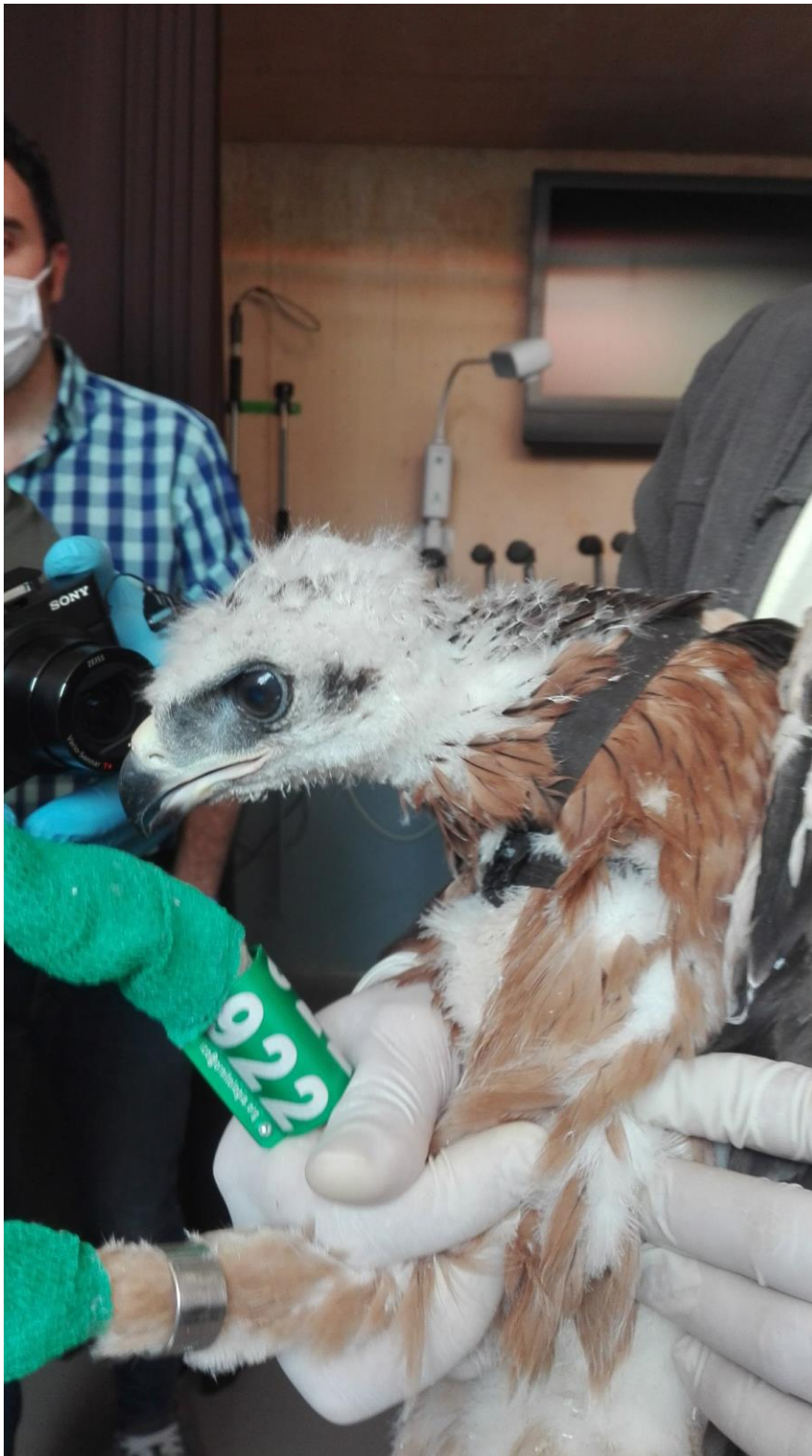
Fig. 1. Marcaje de un pollo nacido en cautividad en GREFA antes de su traslado al punto de liberación en Madrid.