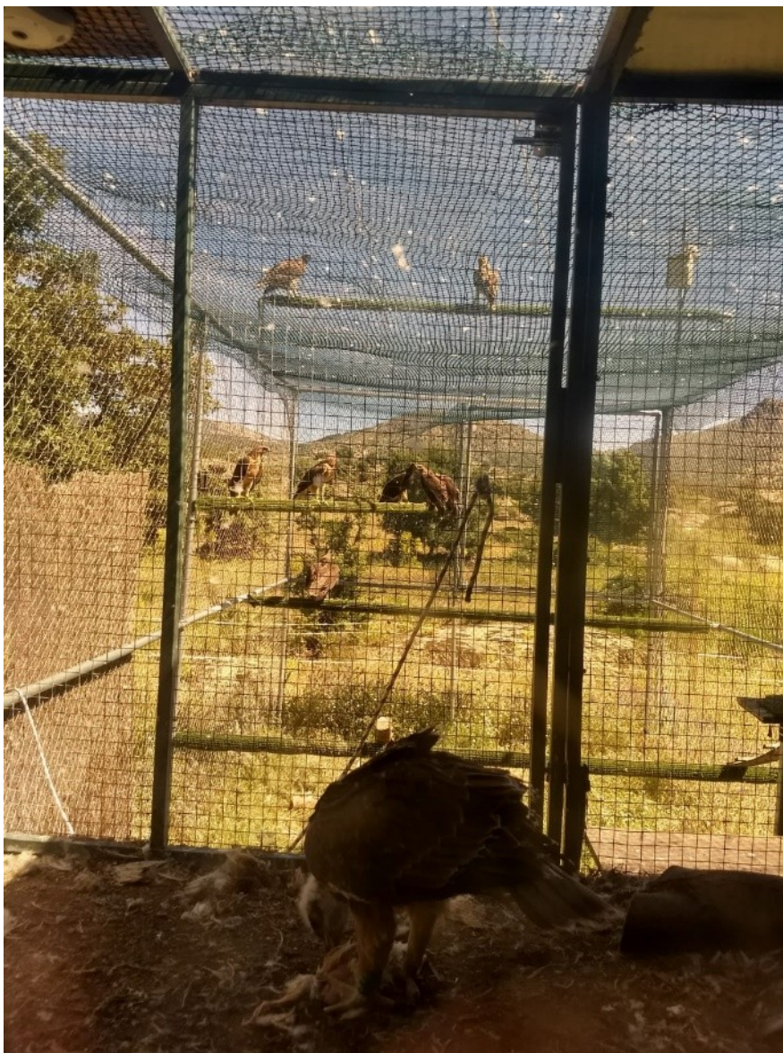
Fig. 12. Las siete águilas nacidas en 2018 dentro de la jaula y "Alameda y Noalejo" observándolas desde el posadero exterior (arriba).