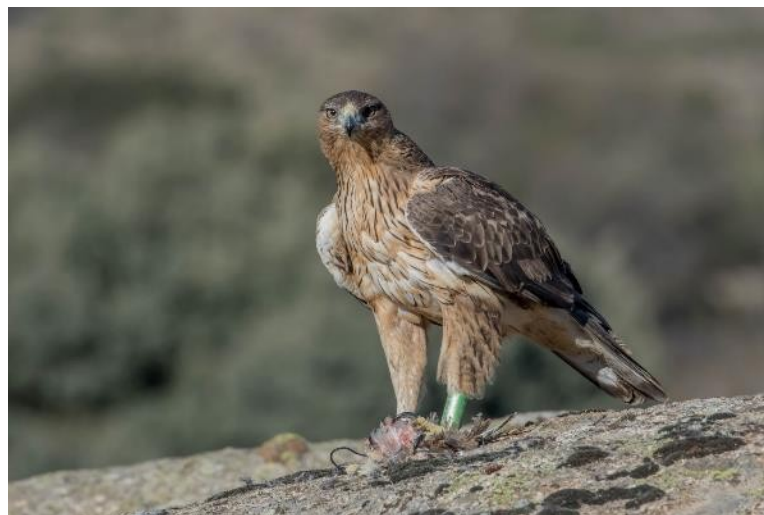
Fig. 1. Noalejo, macho de la nueva pareja formada en 2018.

Durante 2018 se ha realizado la primera liberación de águila de Bonelli o águila-azor perdicera ( Aquila fasciata ) en el marco del proyecto AQUILA a-LIFE (LIFE16 NAT/ES/00235).