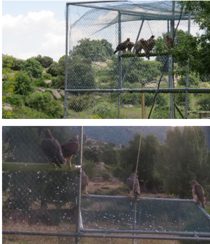
Fig. 4 a 11. Desarrollo del método de liberación mediante “jaula-hacking”.

Como se ha comentado anteriormente, este año estuvo condicionado por la irrupción de una pareja de nueva formación en las inmediaciones de la “jaula-hacking” durante el verano de 2018. Se trata de “Noalejo” (historial 17/1061) y “Alameda” (historial 17/0285) nacidos en 2017 y liberados ese mismo año en el marco del proyecto LIFE Bonelli (LIFE12 NAT/ES/000701). Debido al carácter filopátrico de la especie, han retornado al lugar que interpretan como su lugar de nacimiento para intentar reproducirse. Es cierto, que este hecho podría haber dado al traste con la liberación de 2018 si hubieran sido muy agresivos con los pollos de este año. Afortunadamente, no ha habido ninguna interacción grave entre la pareja recién formada y los pollos liberados.