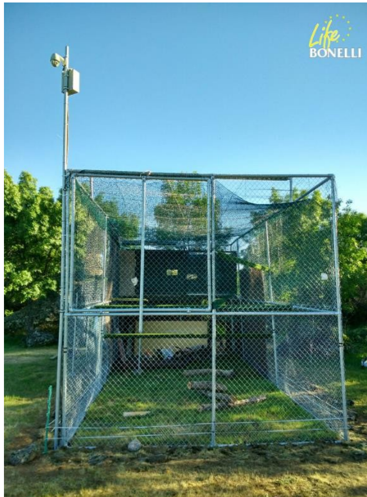
Fig. 2. Visión frontal de la "jaula-hacking".