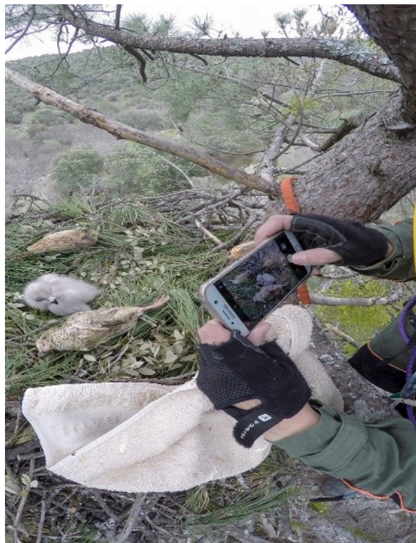
Fig. 16. Momento de la introducción del pollo en el nido de Haza y Bélmez.

Desgraciadamente, el final del invierno y principio de la primavera, con tantas y tan fuertes borrascas en la zona, unido a la inexperiencia de esta pareja primeriza, llevó a que el único huevo que tenían no eclosionara. Pocos días después, allá por mediados del mes de abril, se montó un operativo desde AQUILA a-LIFE, coordinado entre GREFA, la Comunidad de Madrid y sus Agentes Forestales para retirar el huevo y colocar en su nido un pollo de unos 15 días de edad aproximadamente que había nacido en las instalaciones de GREFA; número de historial: 18/0256, de nombre “ Bowie ”. Este pollo nació con una malformación en un ojo aunque esto no le impedía ver con normalidad. Se decidió liberarlo mediante “fostering” en el nido de esta pareja primeriza formada por “Haza” y “Bélmez” y así no perdieran el comportamiento reproductor y asegurar que no abandonaran el territorio.