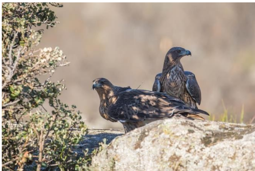
Fig. 13 a 15. Imágenes de la pareja formada por Alameda (hembra 2017) y Noalejo (macho 2017).