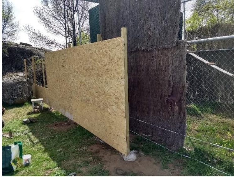
Fig.3. Construcción del pasillo de madera de acceso.