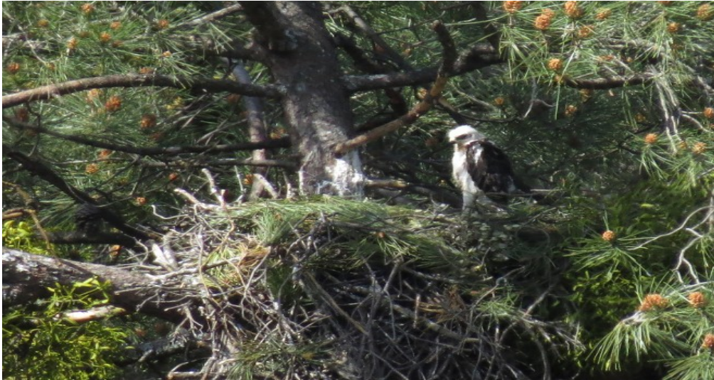
Fig. 17. Imagen de Bowie ya bastante desarrollado en el nido de Haza y Bélmez.

En muy poco tiempo el pollo fue depositado por agentes especializados en trabajos en altura y en poco menos de una hora el nuevo pollo era aceptado por "Haza" y "Bélmez".