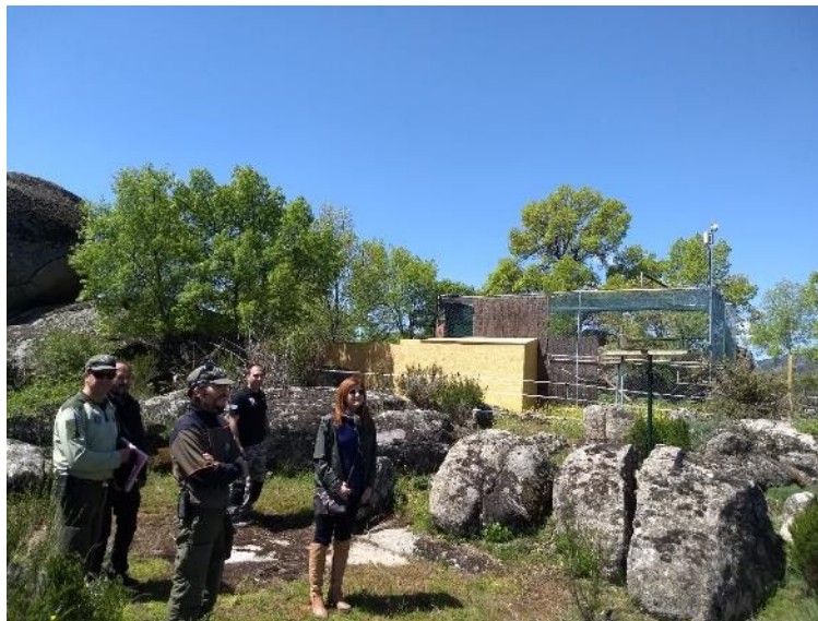
Fig. 3. Instalación finalizada.