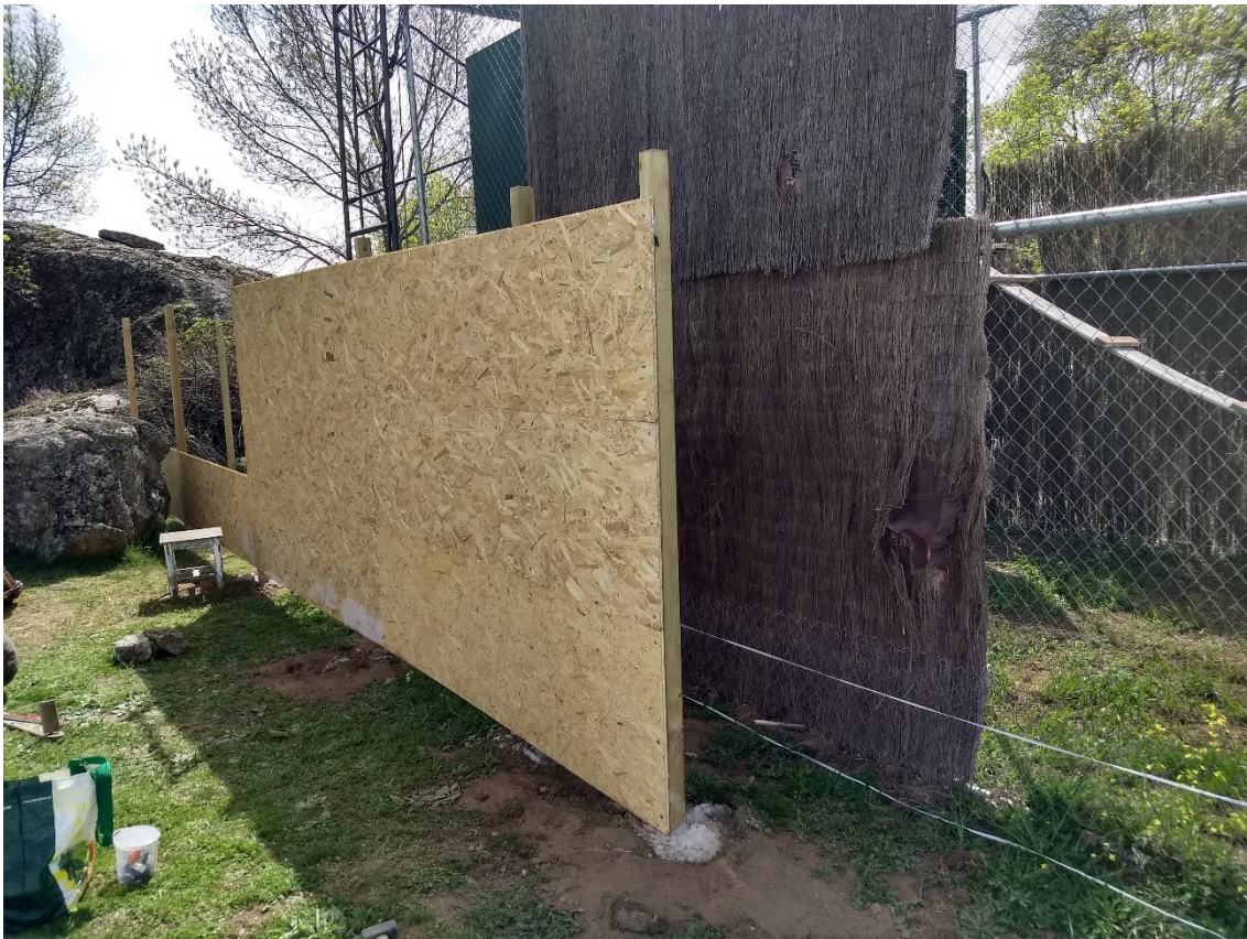
Ilustración 3. Construcción del pasillo de madera de acceso.

También se sustituyó el router y el transformador de corriente para mejorar la señal del sistema de videovigilancia.