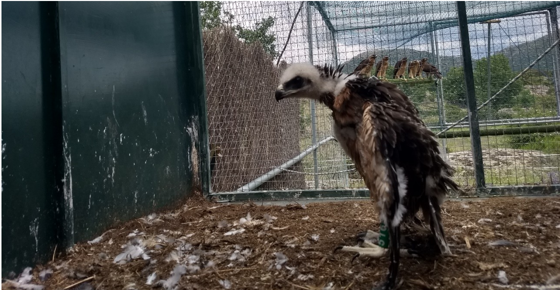
Ilustración 2. Aclimatación para la liberación 2018.

Debido al gran resultado obtenido en el año 2017 y al no haber instalada ninguna pareja, en 2018 se ha mantenido el enclave utilizado situado en un municipio de la sierra oeste madrileña.