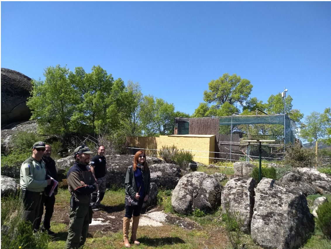
Ilustración 4. Instalación finalizada.